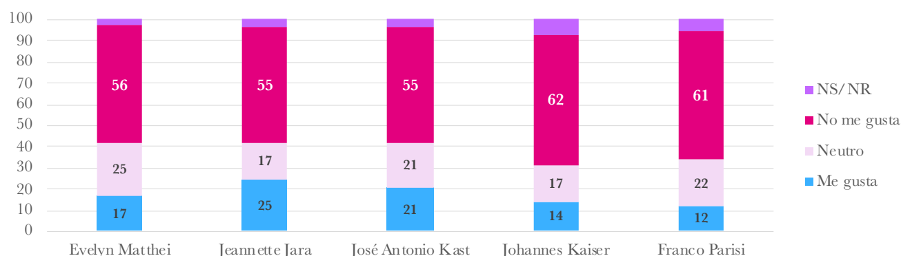
Gráfico 1. Simpatía por los candidatos presidenciales