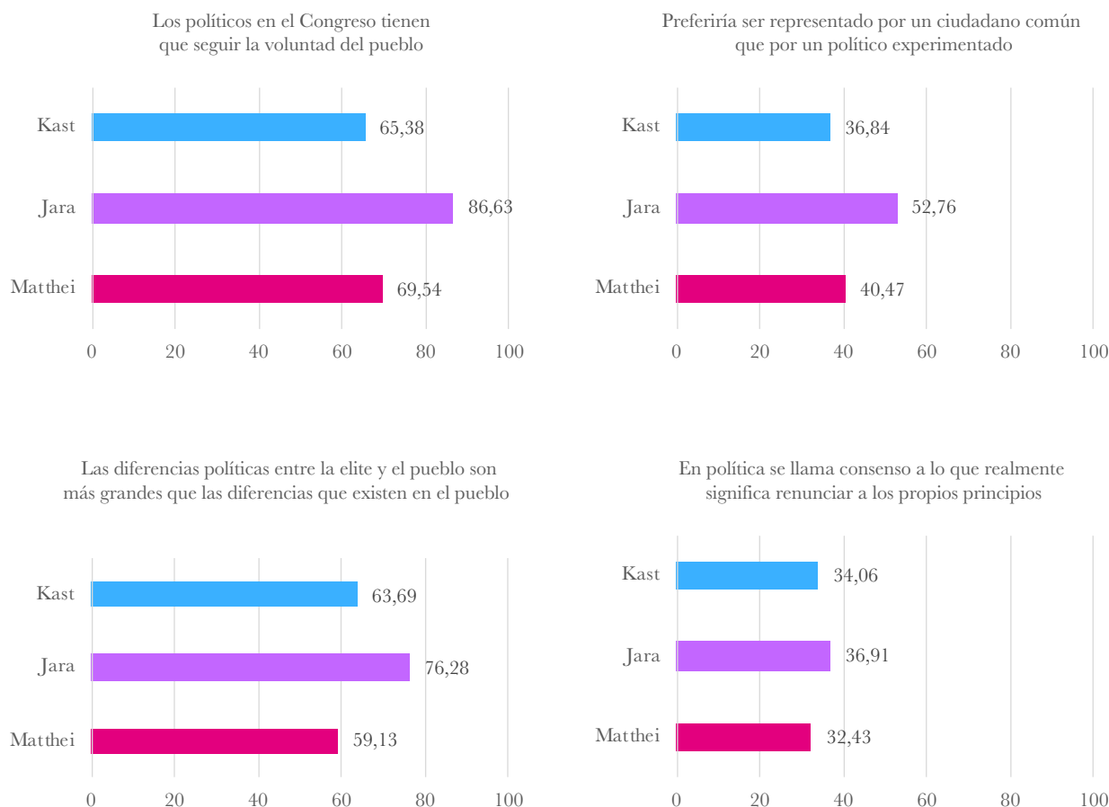
Gráfico 2. Actitudes populistas entre los simpatizantes de los candidatos presidenciales